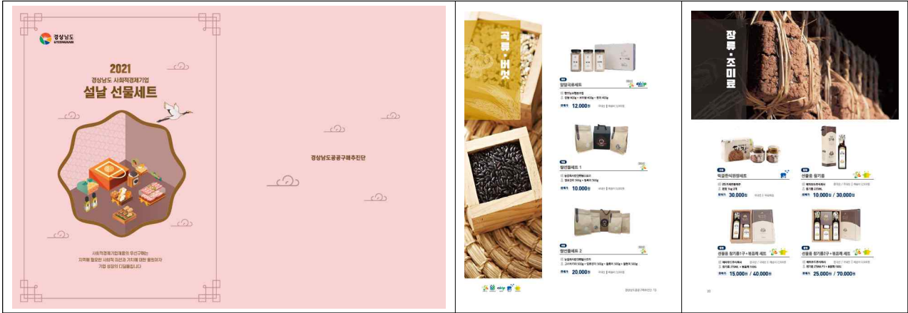
<참고사진 : 2021 설날 명절 카탈로그 디자인>